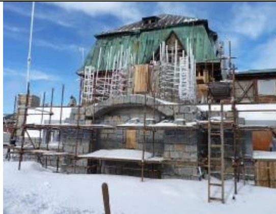
v rekonstrukci (2012)