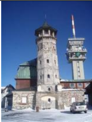
původní stav (2011)

Oblast Centrálního Krušnohoří zaujímá nejatraktivnější část Krušných hor. Cílem projektu je zlepšení infrastruktury. Rekonstrukce kamenné rozhledny na Klínovci vysoké 23 m, která je nejstarší rozhlednou v ČR, probíhá systémem „rozebrat a znovu postavit“. Při rozebírání zdiva se jednotlivé kameny očíslovují, očistí a následně v rámci nové stavby navrací zpět. Autentičnost rozhledny tak bude zachována. Rozhledna bude na vrcholku opatřena webovou kamerou, propojenou přes internet s kamerami v Breitenbrunn, Kurort Oberwiesenthalu a Loučné pod Klínovcem. Tak bude průběžně celoročně monitorována celá oblast pro návštěvníky Krušných hor. Zakoupením 2 ks sněžných roleb (Loučná pod Klínovcem) bude zajištěna úprava více jak 60 km lyžařských běžeckých tras na obou stranách hranice. V Breitenbrunn (osada Tellerhäuser), byla vybudována lyžárna se sociálním zařízením a parkovištěm pro turisty. Podrobně, včetně fotodokumentace viz: www.bozidarsko.cz .