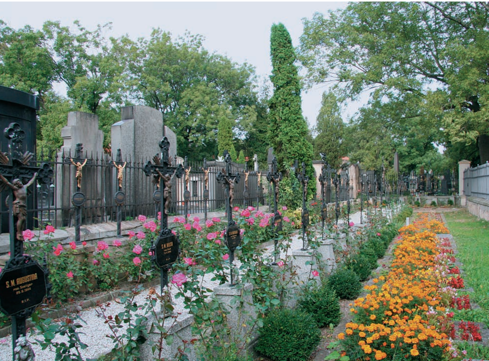
Neveřejný hřbitov konventu sester Alžbětinek (první řada) a sester Voršilek (druhá řada) na Vyšehradě v Praze.