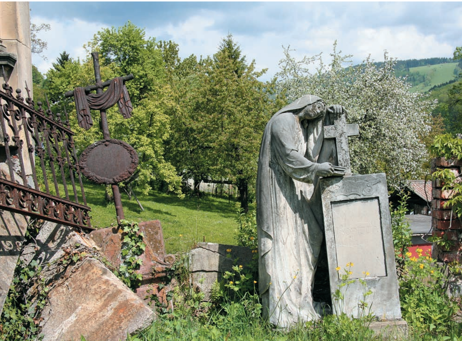
Náhrobek na veřejném hřbitově ve Vrchlabí.