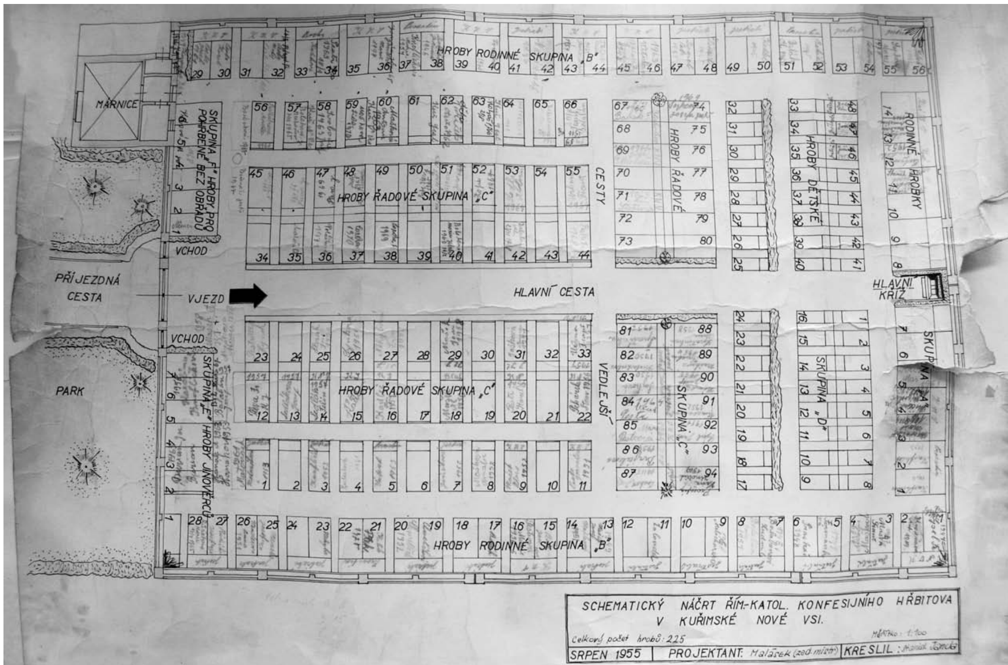
Schématický náčrt římskokatolického konfesijního hřbitova v Kuřimské Nové Vsi z roku 1955. Archiv obecního úřadu Kuřimská Nová Ves.