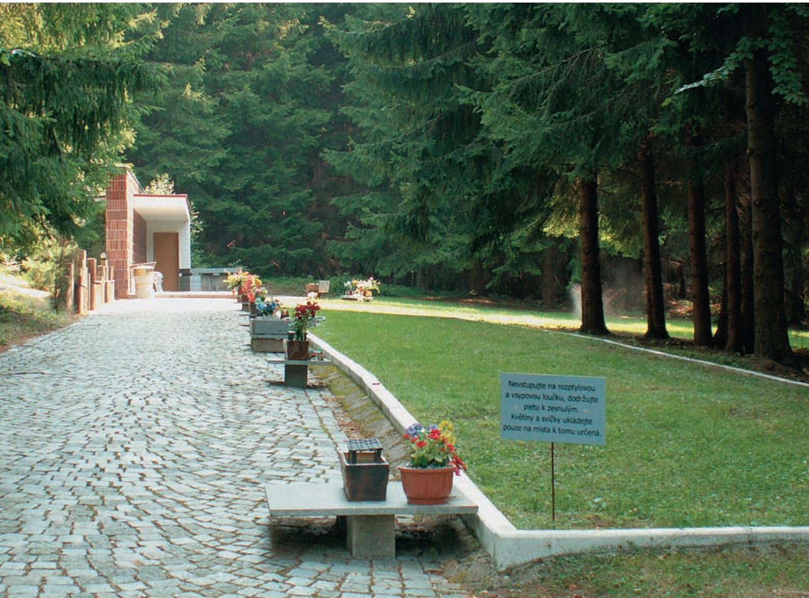
Rozptylová a vsypová loučka u krematoria v Jihlavě (Bedřichov u Jihlavy). Provozovatelem je město Jihlava, správcem Ing. Zbyšek Holeksa / Služby města Jihlavy.