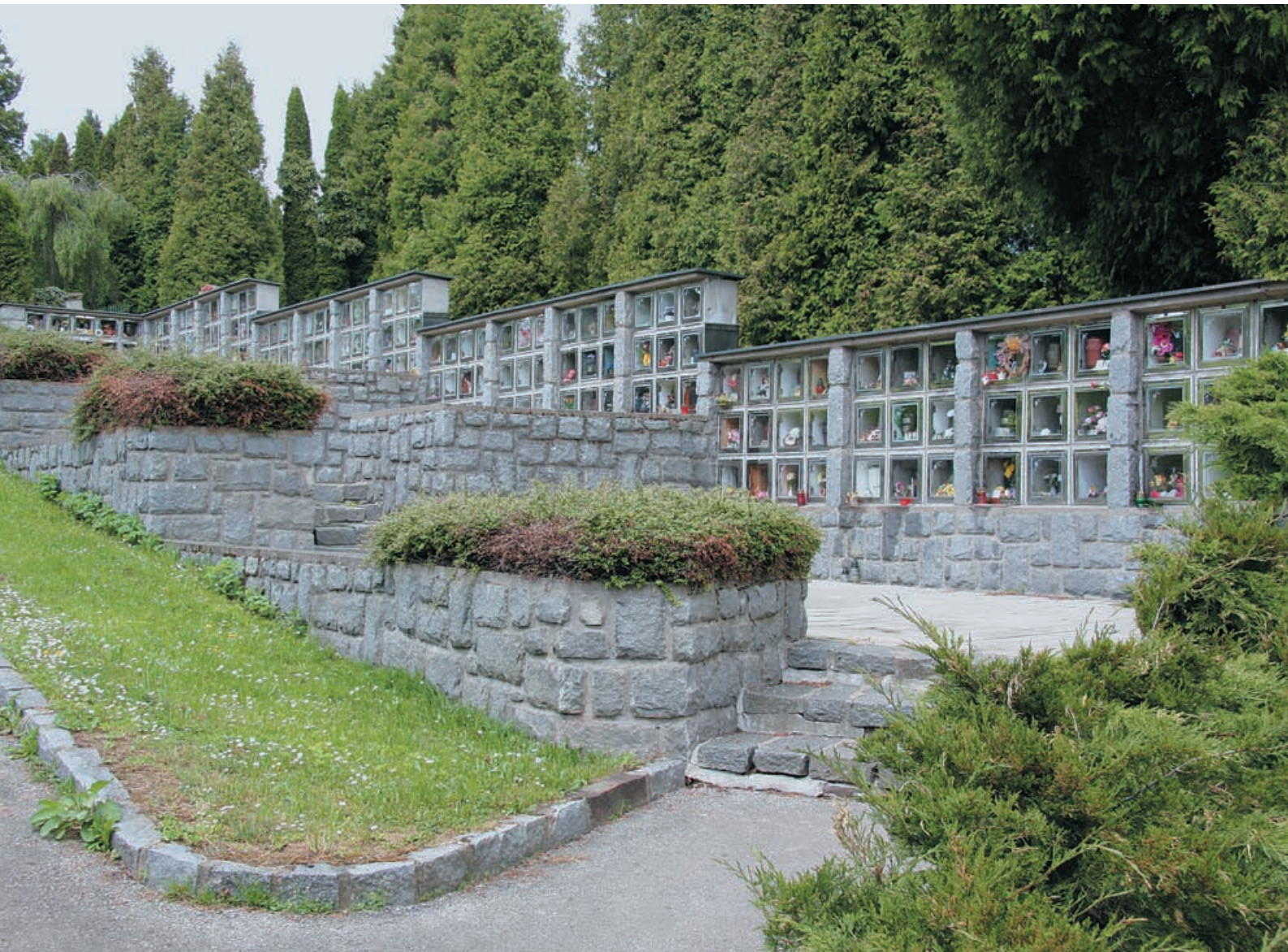
Kolumbárium na veřejném hřbitově ve Vrchlabí. Provozovatelem je město Vrchlabí, zastoupené starostou města, správcem Ing. Milan Mašek / Pohřební a hřbitovní služby.