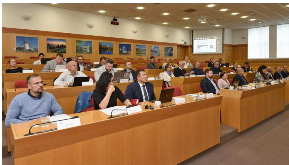
Foto : Zasedání RSK MSK dne 13.10.2023

Informace o činnosti RSK MSK (zápisy a prezentace z jednání) jsou k dispozici na webových stránkách kraje: