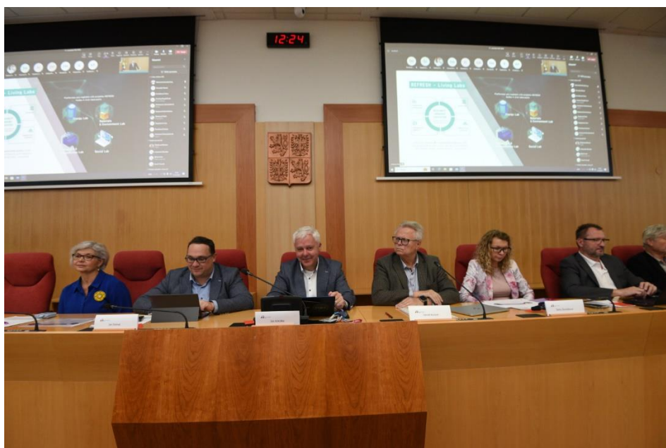
Foto : Zasedání RSK MSK dne 13.10.2023