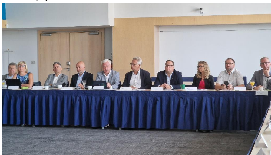
Foto : Zasedání RSK MSK dne 18.7.2023

RSK MSK přijala na svém 19. zasedání celkem 4 stanoviska.