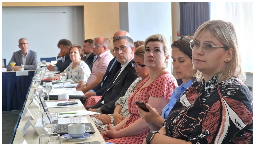
Foto : Zasedání RSK MSK dne 18.7.2023